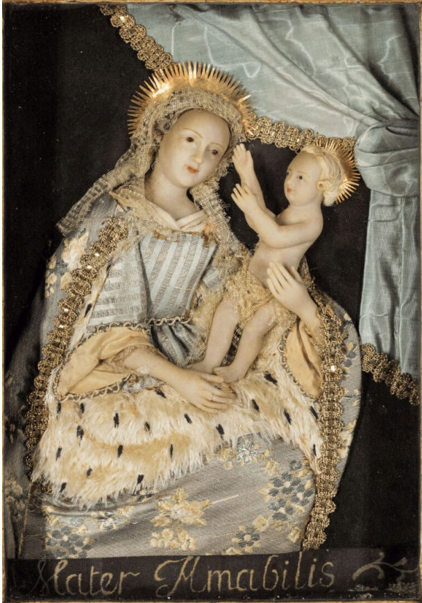
Mater Amabilis, atelier des frères Guillot, XVIII e siècle, 28,5 x 23,5 cm, Nancy.

expose une collection riche et inédite d'une tradition locale oubliée : de curieux petits tableaux en cire moulée, habillée d'étoffes. Au total, deux cents pièces d'un art méconnu qui nous fait revivre un siècle de piété populaire en Lorraine et en France.