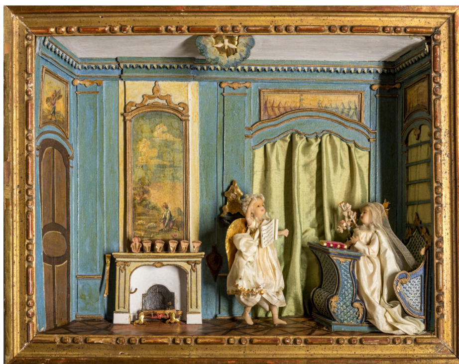
L'Annonciation, fin XVIIIe siècle, Nancy, 36 x 28,5 cm. © Jean-Pierre Gobillot