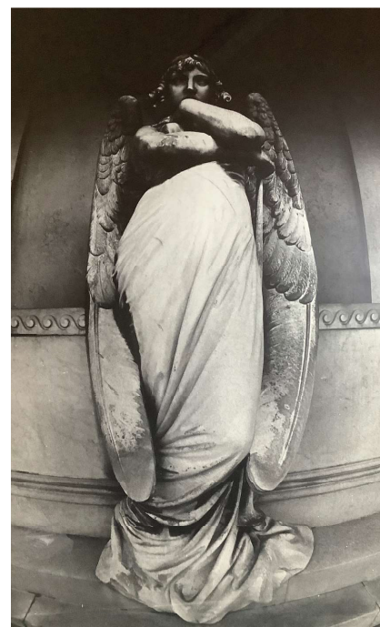
Photographie de la série « Monuments funéraires », 1978, tirage en noir et blanc, H. 188 ; L. 124 cm, donation Henri-Pierre Thibaudier, février 2024