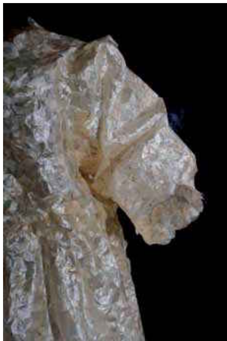
Isabelle Tournoud, Petite fille du vent , 2010, monnaie du pape et colle, 100 x 40 x 20 cm

Dans deux hauts lieux bourguignons, une double exposition réunit 60 œuvres de 18 artistes explorant, de leur identité féminine, la notion de spiritualité.