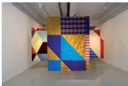
Vue de l'exposition Ulla Von Brandenburg, Wagon Wheel , 27 novembre 2009 - 6 février 2010, Pilar Corrias, Londres.

Deux artistes commissaires d'expositions à l'Institut d'Art Contemporain de Villeurbanne. A l'occasion des Pléiades - 30 ans des FRAC Vincent Lamouroux présente Transformations, un dispositif sculptural avec une sélection d'œuvres de la collection de l'IAC.