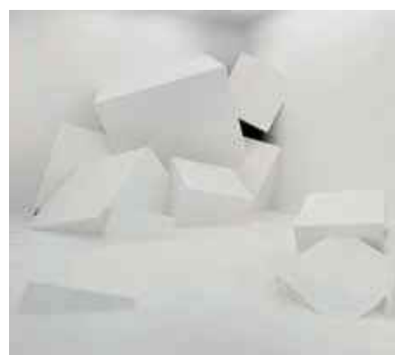
Vincent Lamouroux, AR_07 , 2008, Vue de l'exposition Fabricateurs d'espaces, 17 octobre - 04 janvier 2008, Institut d'art contemporain, Villeurbanne/Rhône-Alpes