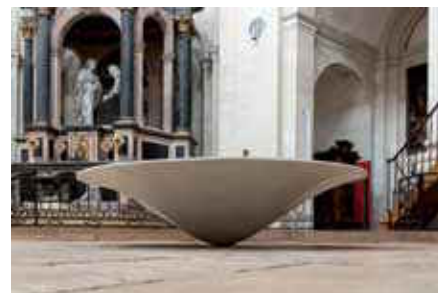
Aliska Lahusen, Grand bol de pèlerin blanc , 2007, laque sur âme de bois, 40 x 200 x 200 cm © Jean-Pierre Gobillot