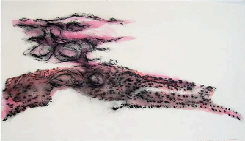
1. L'arbre et le chemin 11,16 2 08, acrylique et fusain, 68,8x121 cm, 2008